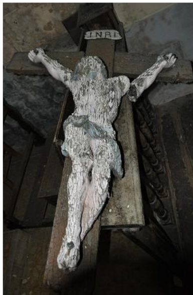
Crucifix à l'abri