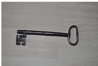
La clé du 'paradis'